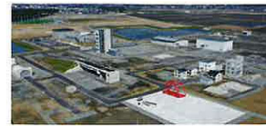
福島ロボットテストフィールド